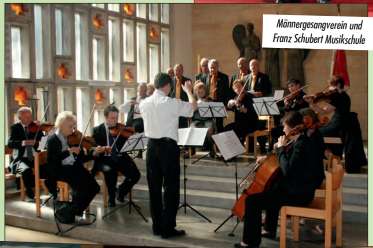
Männergesangsverein und Franz Schubert Musikschule