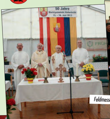
Feldmesse im Festzelt