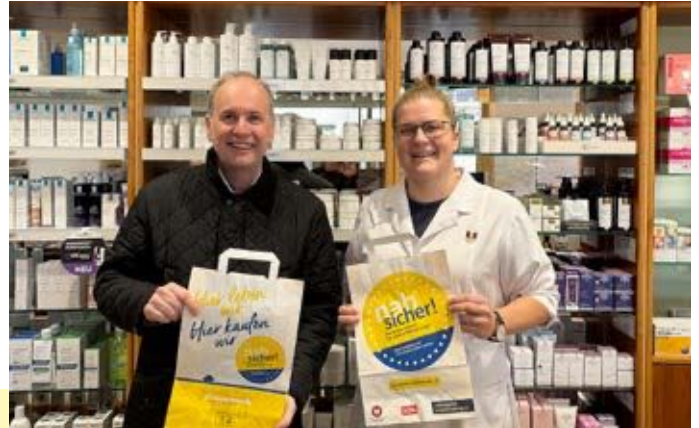
Apotheke Zur Heiligen Dreifaltigkeit Hinterbrühl