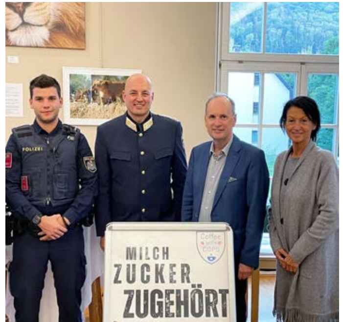
Coffee with Cops