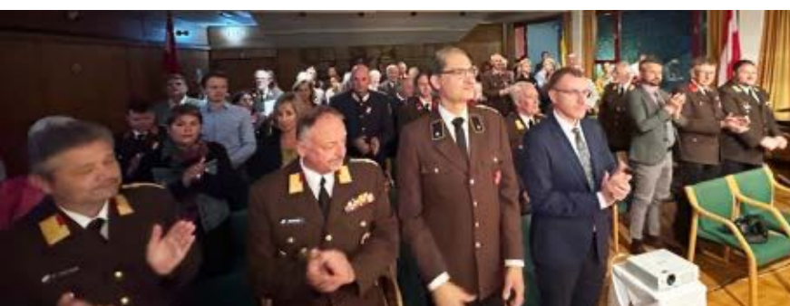
Festgäste der Festsitzung