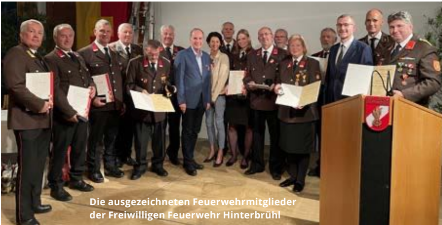
Die ausgezeichneten Feuerwehrmitglieder der Freiwilligen Feuerwehr Hinterbrühl

Fast ging es buchstäblich im Hochwasser „unter“: Inmitten des schweren Hochwasser-Wochenendes feierte die Freiwillige Feuerwehr Hinterbrühl ihr 150 jähriges Jubiläum. Zahlreiche Ehrengäste, feierten diesen denkwürdigen Festtag.