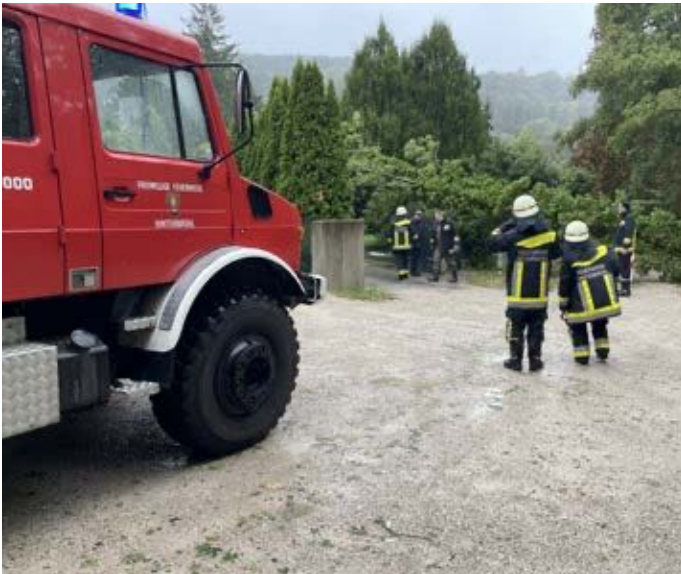
Die freiwillige Feuerwehr im Einsatz