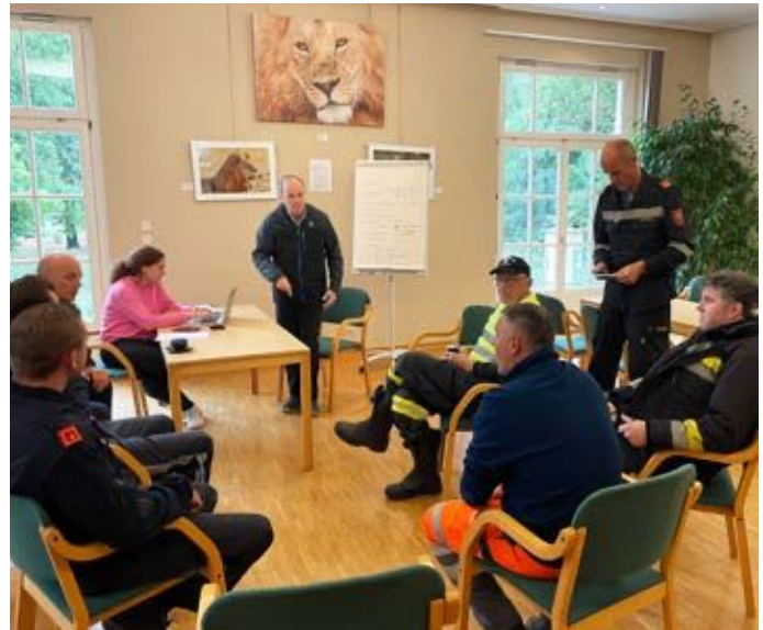
Krisenstab am Gemeindeamt

Starke Regenfälle trafen Mitte September das ganze Bundesland NÖ, speziell betroffen war auch der Wienerwald. Es kam in unserer unmittelbaren Nachbarschaft in Grub, Sulz aber auch Münchendorf etc. zu massiven Überflutungen und Bachaustritten, Flüsse gingen über und Grundwasser drang in Häuser ein.