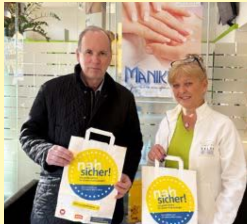
Verwöhntempel Salon Hinterbrühl