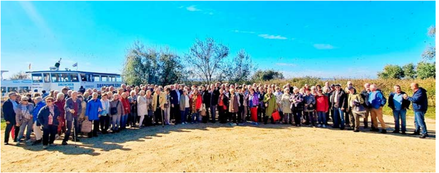
Ausflug der Hinterbrühler Senioren

Rund 200 Hinterbrühler Seniorinnen und Senioren nahmen am heurigen Seniorenausflug teil. Die Fahrt ging diesmal ins Burgenland, für die eine Hälfte der Gruppe stand das Schloß Halbturn mit der Sonderausstellung der Habsburger vormit-