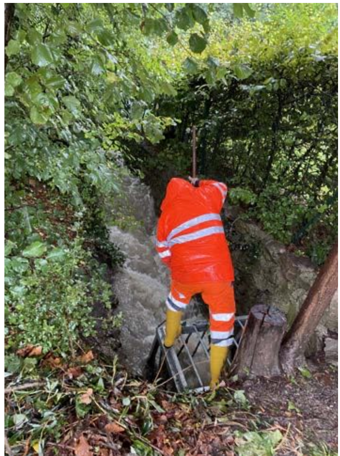
Gemeindemitarbeiter des Straßendienstes im Hochwassereinsatz

Ein großer Dank an alle freiwilligen Feuerwehren sowie alle anderen Helfer, die in unserem Ort wertvolle Arbeit für unsere Gemeinschaft leisteten!