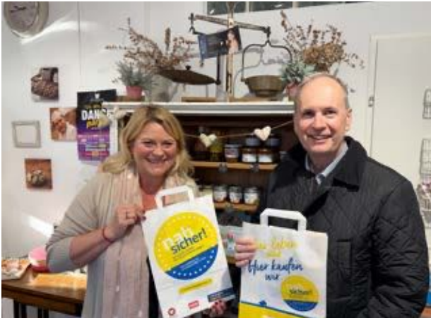
Kolm die Bäckerei Hinterbrühl